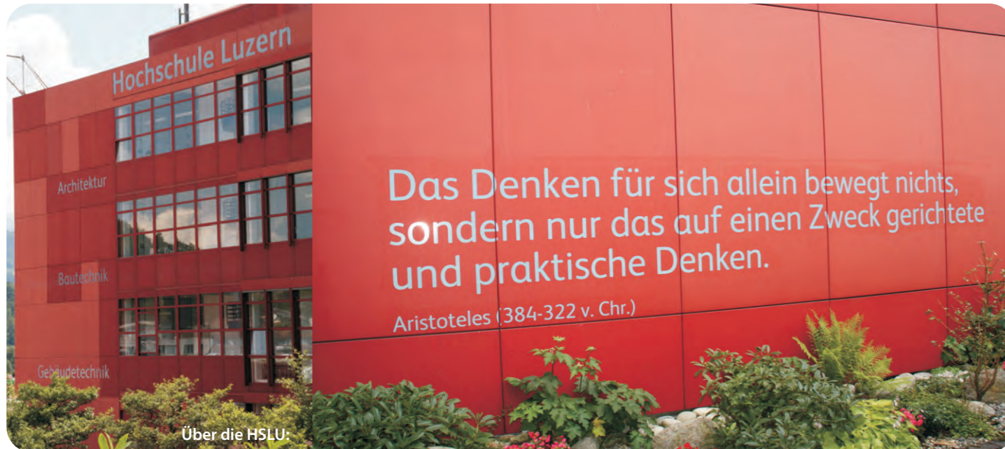
Über die HSLU:

Die Teilschulen der Hochschule Luzern befinden sich alle in der Stadt oder Agglomeration Luzern. Die Hochschule Luzern ist deshalb von allen Fachhochschulen der Schweiz jene mit der grössten räumlichen Konzentration.