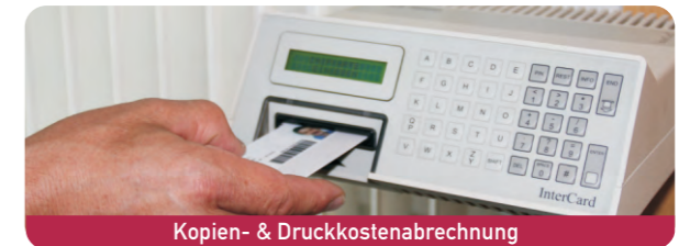
Kopien- & Druckkostenabrechnung